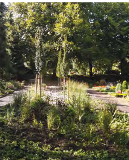
Das Modul „Fluss des Lebens“ bietet neben dem „Auengarten“ neue Grabstätten auf dem Waldfriedhof.